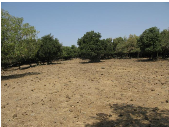
קרחת יער בינונית