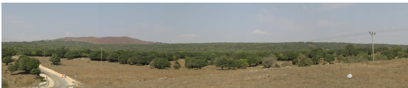
מבט כללי על היער מדרום-מערב

לאלה שלא מכירים, מובא להלן תאור היער מאחד מהניווטים הקודמים, עם עדכונים קלים. מיפוי השטח החל בשנת 2009 ובוצע ברובו עד 2011, עם הרחבות ב-2015 וגם תוספת קטנה השנה – בסך הכל 150 שעות עבודת שטח ומפה של 6 קמ"ר.